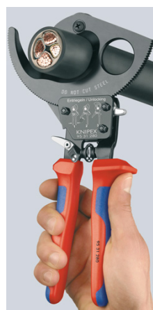
Принцип трещотки и двухходовой зубчатый привод для резания с меньшим усилием