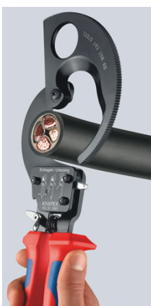
95 31 280: Увеличенный раcтвор: максимальный Ø 52 мм/380 мм 2